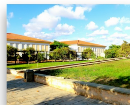
Escola Secundaria Pinheiro e Rosa